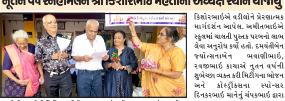
અમરેલી, અમરેલી સિનિયર સીટીઝન સોસાયટી દ્વારા સ્નેહમિલન યોજાયું. અમરેલી, અમરેલી સિનિયર સીટીઝન સોસાયટી દ્વારા સ્નેહમિલન યોજાયું.