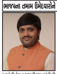
અમરેલી, દેશના યશસ્વી પ્રધાનમંત્રી શ્રી

ભાજપના તમામ ઉમેદવારોને જંગી બહુમતી મેળવે તેવી શુભેચ્છાઓ સાથે ખુશી વ્યક્ત કરી