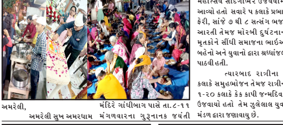
અમરેલી, અમરેલીમાં શ્રી સુખ અમરદામ મંદિરે ગુરુનાનક જયંતી ઉજવાઈ. અમરેલી, અમરેલીમાં શ્રી સુખ અમરદામ મંદિરે ગુરુનાનક જયંતી ઉજવાઈ.